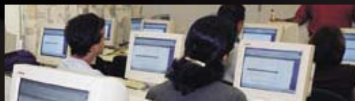
Emisión a la pantalla del alumno (la alternativa al proyector)

Radix Smart Class transforma su aula de informática en un entorno exclusivo e interactivo en el que el profesor tiene pleno control. Simplemente presionando un botón, el profesor puede emitir presentaciones de alta calidad a los estudiantes, monitorizar las pantallas de los estudiantes, apagar las pantallas para captar la atención y recuperar los equipos averiados sin molestar al resto de la clase.