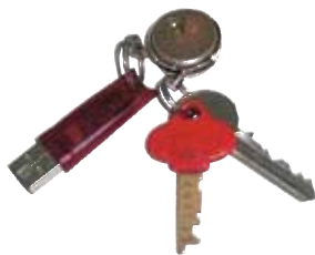
Llave USB (opcional)

Incluso los ordenadores más fiables están sujetos a fallos derivados de errores del usuario, fallos del sistema ("pantallas azules"), pérdida de ficheros, virus, etc. Con Reload instalado, los usuarios pueden recuperar sus ordenadores averiados fácilmente y deshacer cualquier cambio no deseado en unos segundos.